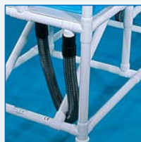
Tubo de desagüe de 90 cm; otras medidas por encargo.