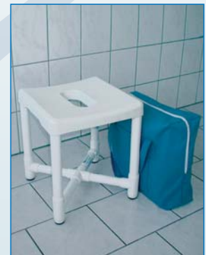
DH 49 R Taburete de viaje Fácil montaje Funda de 43 x 43 x 19 cm Peso 3,8 kg