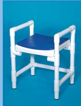
DH 49 A PA Asiento de ducha con apoyabrazos fijos A Asiento blando PA Foto: color azul cobalto Carga hasta 150 kg