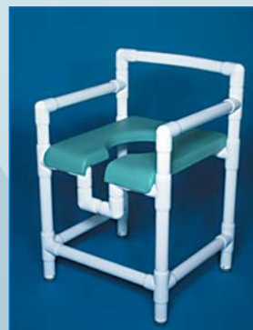
DH 90 PP Asiento de ducha con respaldo incurvado, asiento blando con abertura higiénica PP , abertura para entrada en la taza de WC Carga hasta 150 kg