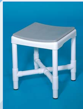
DH 49 PA Taburete con asiento blando PA . Foto: color gris Carga hasta 200 kg