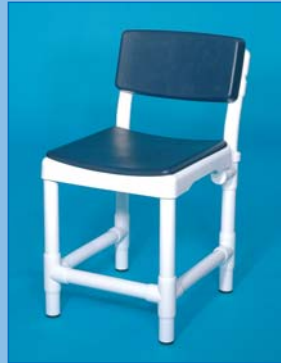
DH 49 PRS PA Asiento con respaldo alto PRS , asiento blando PA , Foto: color azul oscuro Carga hasta 150 kg