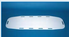
PTB Plancha de Transfer