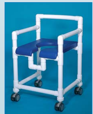
DH 100 PP Silla de ducha con ruedas dobles de 75 mm Ø con freno Asiento blando con abertura higiénica PP , abertura para entrada en la taza de WC Carga hasta 150 kg