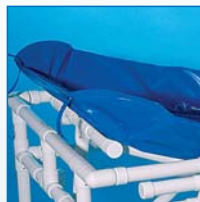
Reposacabezas ajustable VR