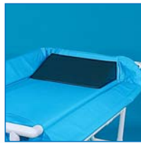
Almohada impermeable DK