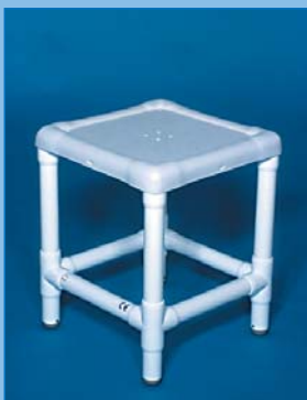
DH 55 Taburete clásico de RCN Con asiento ancho fijo, Carga hasta 300 kg