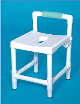
DH 49 RL Asiento de ducha con respaldo, revestimiento RL Foto: color laguna Carga hasta 150 kg

Los taburetes de ducha en resina sintética que se adaptan a las demandas más exigentes