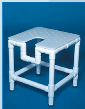
DH 56 Taburete XL, asiento perforado con abertura higiénica Carga hasta 300 kg