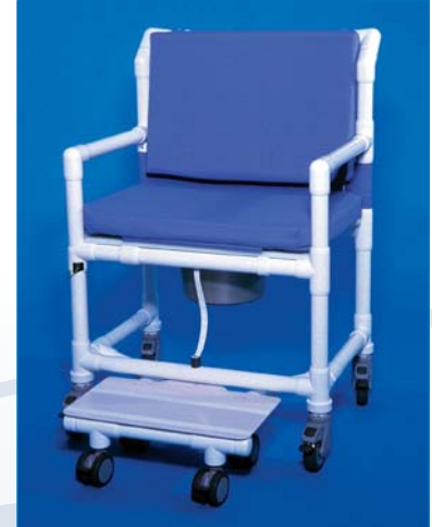
SCC 250 OS DS ASAOS MFTOS RPOS SPOS