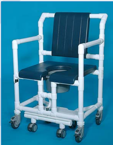
SCC 250 OS PPG