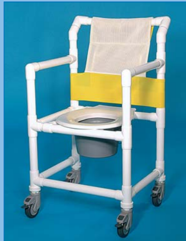
SCC 250 XL

¡Pídanos siempre primero un presupuesto!