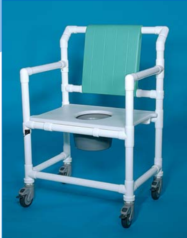
SCC 250 OS DS ASAOS PR