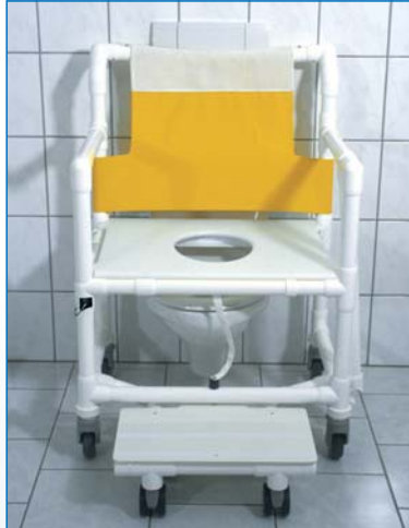
SCC 250 OS DS ASAOS MFTOS