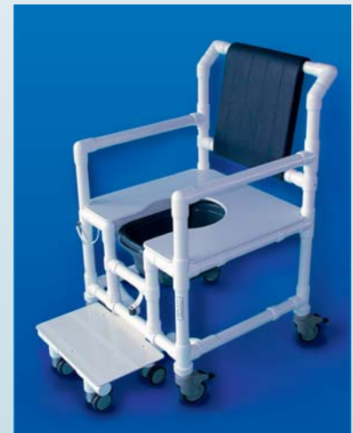
Silla multifunción XXXL de diseño especial

Además de nuestros modelos estándar, RCN puede realizar unidades especiales según sus indicaciones con una variedad casi ilimitada de posibilidades, de acuerdo con el requerimiento individual de sus pacientes. Todo ello en unos plazos y precios muy razonables.