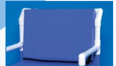
RPOS Respaldo acolchado

Respaldo acolchado de fácil colocación con clips, en PU: PR