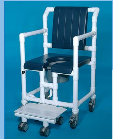
SCC 250 XL PPG