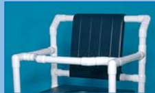
SBOS Barra de seguridad de tronco

Respaldo acolchado de fácil colocación con clips, en PU: PR