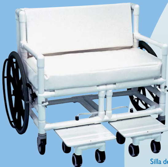
Silla de diseño especial

Además de nuestros modelos estándar, RCN puede realizar unidades especiales según sus indicaciones con una variedad casi ilimitada de posibilidades, de acuerdo con el requerimiento individual de sus pacientes. Todo ello en unos plazos y precios muy razonables.