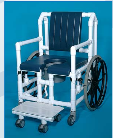
DR 250 OS PPG