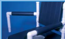
AS-AOS Apoyabrazos derecho removible (a izq. o ambos, sobre pedido)

Reposabrazos acolchados en espuma PU: AP