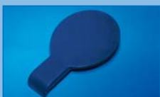
PPE Tapa de cierre blanda para PPOS, PPML o PPXL