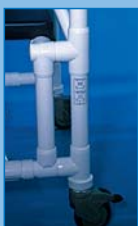
STE Extensión de profundidad del asiento hasta 52 cm o más

Asiento blando reforzado en espuma PU con abertura higiénica frontal. PPOS 44 cm ancho PPML 50 cm ancho PPXL 56 cm ancho