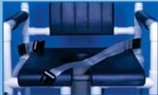
SGOS Cinturón de seguridad