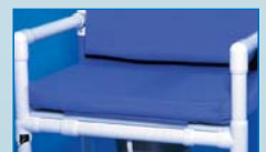
SPOS Cojín de asiento lavable y removible