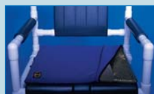
GKGOS Cojín de gel Medidas: 61 x 51 x 2,5 cm