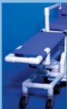
B-AOS Apoyo para la extremidad inferior regulable en altura, para pierna dcha. o izq.