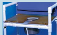
GKOOS Cojín de gel con abertura Medidas: 61 x 51 x 2,5 cm