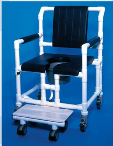
SCC 250 OS PPG AP STE